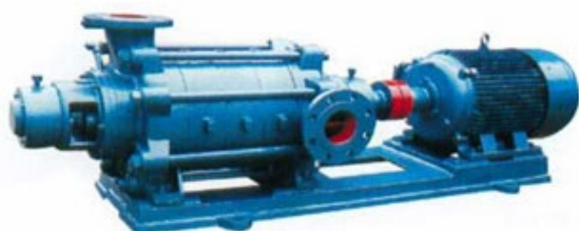
( TSWA型 )